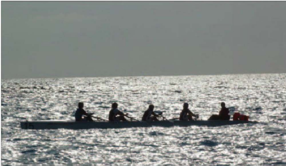
L'aviron niçois sort de l'ombre et gravit les échelons à la force des bras